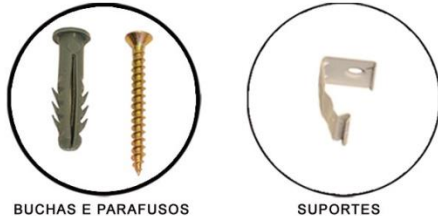
BUCHAS E PARAFUSOS