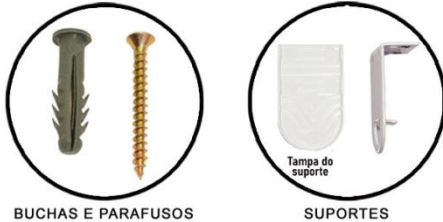
BUCHAS E PARAFUSOS